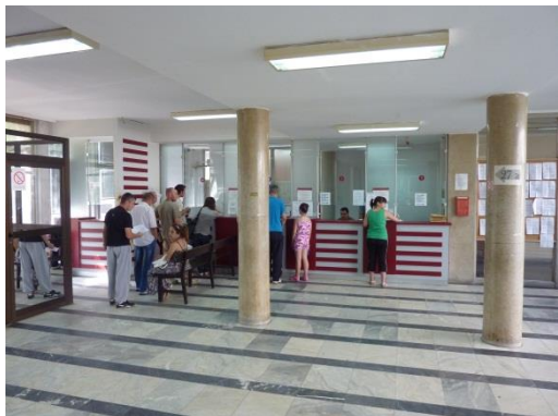
Red ispred šaltera za administrativne usluge u Osnovnom sudu, 2014.godine

U međuvremenu, efikasnost administrativnih usluga 21 je na visokom nivou i popravlja se, ali će mnoge od ovih funkcija nažalost uskoro biti ukinute u sudovima. Vreme potrebno za overu dokumentacije je smanjeno za jednu trećinu u periodu od 2009. do 2013. godine, a u polovini