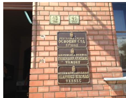
Višejezična tabla ispred Osnovnog suda u Vršcu, 2014.godine

Jednak pristup za osetljive grupe predstavlja specifičan izazov. Većina ispitanih građana smatra da je pravosuđe jednako dostupno svima, bez obzira na starost, socijalno-ekonomski status, nacionalnost, invaliditet i jezik. Međutim, oni građani koji su stariji od 60 godina, ili žive u ruralnim područjima ili imaju najniži stepen obrazovanja smatraju da je pravosudni sistem posebno nepristupačan, ukazujući da su ciljne intervencije opravdane. Lica s intelektualnim i mentalnim zdravstvenim problemima susreću se sa velikim preprekama u procesu u kojem im se oduzima pravna sposobnost. Pripadnici romske zajednice, izbeglice i interno raseljena lica takođe navode nisku svest o njihovim pravima, kao i zabrinutost vezanu za pravičan tretman pred sudom. Kada je reč o ovakvim grupama, postoji dobar razlog za širenje informacija relevantnim organizacijama civilnog društva i vođama zajednica o funkcionisanju pravosuđa i osnovnim zakonskim pravima. Iskustva LGBT populacije su malo drugačija: iako deluje da su oni više upućeni u svoja zakonska prava od gore pomenutih grupa građana, oni oklevaju da podnose predmete pred sudom zbog straha od odmazde i percepcije diskriminacije.