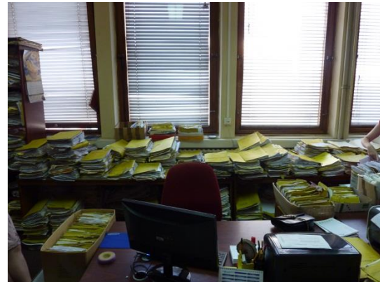
Slika Pisarnice u Osnovnom sudu, 2014.god