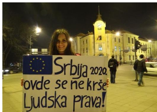
Naslov: Serbia 2020 , fotografija učesnika u nagradnom konkursu, Svetska banka MDTF-JSS, 2014. godine

U širem smislu, pravosudni sistem Srbije se bori da dostigne punu usklađenost sa zahtevima EKLJP, o čemu svedoči veliki broj predmeta u Strazburu. Neusklađenost se može utvrditi u ograničenom broju vrsta predmeta, što ukazuje na specifične probleme vezane za nedoslednu primenu zakona i neizvršenje konačnih presuda protiv državnih preduzeća. Stoga se čini da je veći deo neusklađenosti u Srbiji povezan sa finansijskim tužbama protiv državnih preduzeća, a ne sa strukturnim problemima u pravosudnom sistemu.