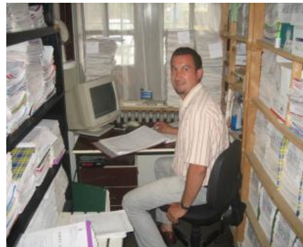
Slika stešnjenog radnog prostora u Prekršajnom sudu, 2013. godine.

Nedovoljni kapaciteti postojeće infrastrukture utiču na pružanje usluga. Postoji nedostatak sudnica u sudovima i kabineta u tužilaštvima. Mnogi akteri ističu loše radne uslove kao bitan razlog nižeg kvaliteta sudskih usluga. Sudovi se uglavnom nalaze u zgradama koje su označene kao kulturno nasleđe, što otežava i poskupljuje održavanje i renoviranje. Pored problema s održavanjem, neke od zgrada nisu namenjene da budu sudovi, tako da ne pružaju funkcionalan prostor. U mnogim slučajevima, dvoje ili troje sudija dele isti kabinet i taj isti kabinet koriste i kao sudnicu, što izaziva zabrinutost u pogledu privatnosti i bezbednosti. Uprkos tome, postojeće sudnice se ne koriste optimalno. Rošišta se održavaju samo pre podne, a raspored suđenja bi mogao da bude gušći kako bi se maksimalno iskoristio ovaj ograničeni resurs. Nedostatak prostora takođe stvara prepreke reformama koje teže poboljšanju pružanja usluga, kao što je formiranje pripremnih odeljenja.