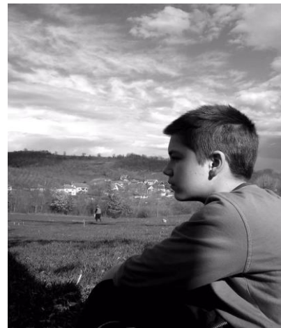
Naslov: Svetlost pravde obasjaće i mene, fotografija koju je poslao učesnik u nagradnom konkursu, Svetska banka MDTF-JSS, 2014. god

Nedovoljna pristupačnost uslugama pravosuđa takođe ima negativan efekat na poslovnu klimu. Više od jedne trećine kompanija sa nedavnim iskustvom u sudskim predmetima navelo je da je sudski sistem velika prepreka za njihove osnovne poslovne aktivnosti, a dodatnih 30% navodi da smatra sudove umerenom preprekom. Poslovni sektor takođe navodi da su im sudovi u sve većoj meri nedostupni zbog visokih sudskih taksi i advokatskih nadoknada. Male kompanije su posebno suočene sa izazovom u kretanju kroz sudski sistem, uključujući visoke troškove, komplikovane procedure, duga odlaganja, neadekvatno izvršenje i stalnu izmenu zakona i propisa.