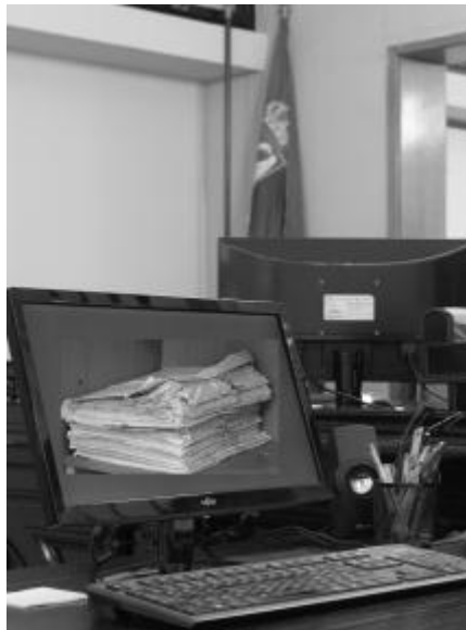
Naslov: Efikasna Primena Tehnologije , poslao jedan učesnik Konkursa pravosuđa, Svetska banka, 2014.

41. Formirati čvršće strukture upravljanja IKT-om kako bi se obezbedili ciljevi budućih investicija u sektoru pravosuđa i zadovoljavanje poslovnih potreba. 102 Aktivnosti treba da počnu kratkoročno i zahtevaju neke troškove: