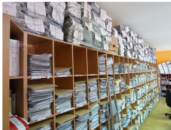
Pisarnica izvršnog odeljenja osnovnog suda, 2014.god